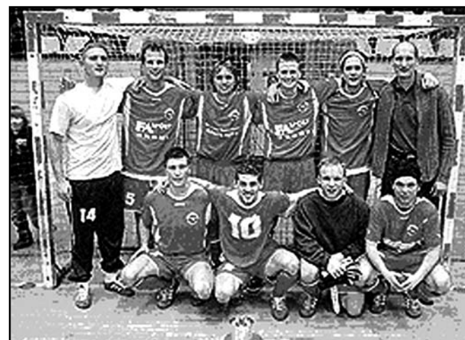
Østerbro's vindende mandskab: